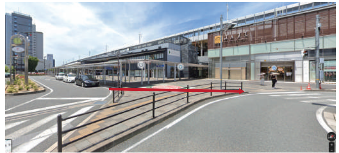
福山駅“南口”を出て左手に進む